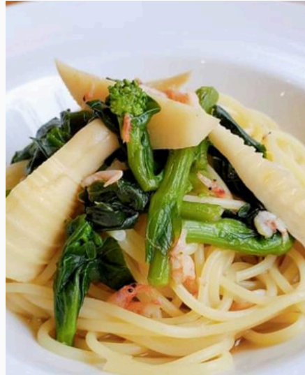
長岡京産筍と菜の花の和風パスタ

肉質柔らかいエビとイカを使用し トマトクリームで春らしい色合いの ソースがブロッコリーと絡む一品