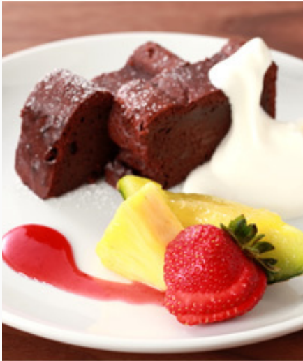
ガト-ショコラ ¥600(税込)