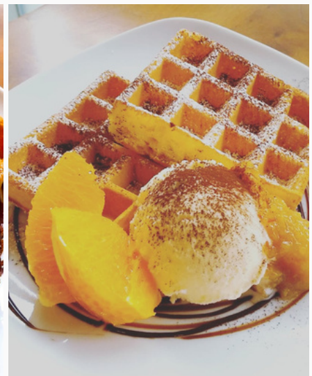
オレンジショコラワッフル