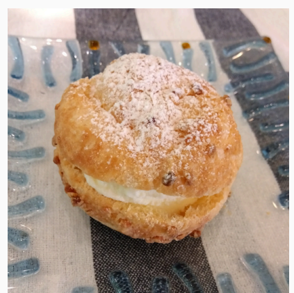
シューアイス(バニラ) ¥450(税込)