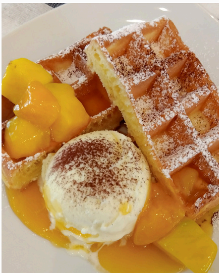
マンゴーワッフル

長岡京産のたけのこを使用 ほろ苦い菜の花、桜えびと合わせ 優しい味の和風パスタに仕上げました