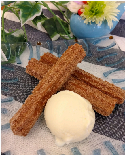
チュロス-バニラアイス添え- (シナモン、抹茶、いちごみるく) ¥450(税込)