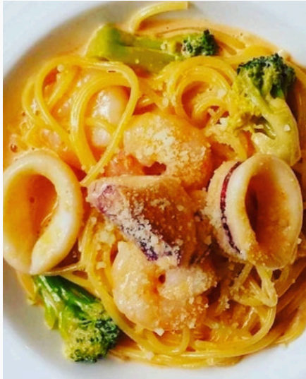
えびとイカのトマトクリームパスタ