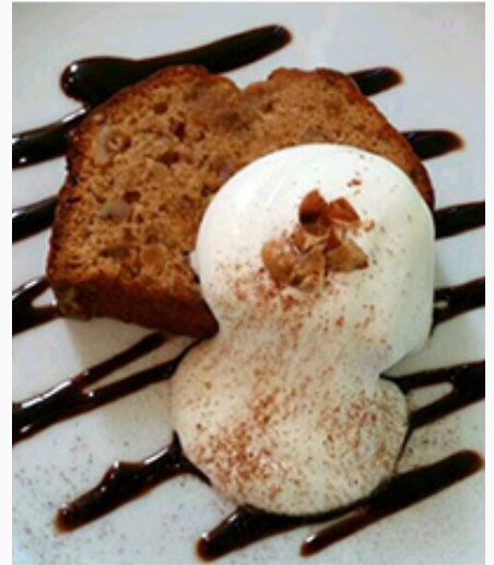
いちじくパウンド ¥600(税込)