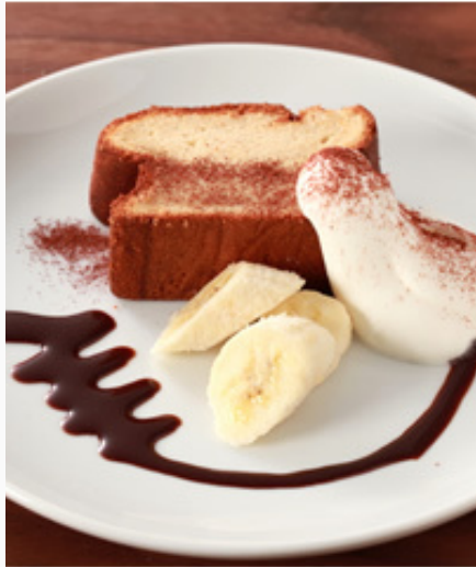
パウンドバナナ ¥600(税込)