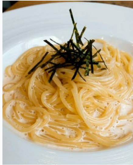
明太子クリームパスタ