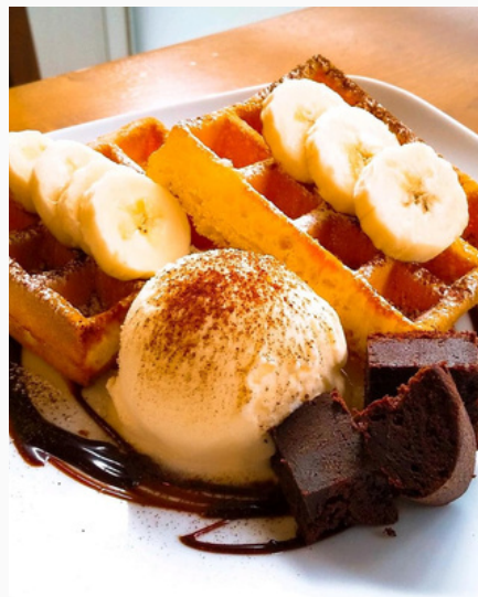
バナナショコラワッフル