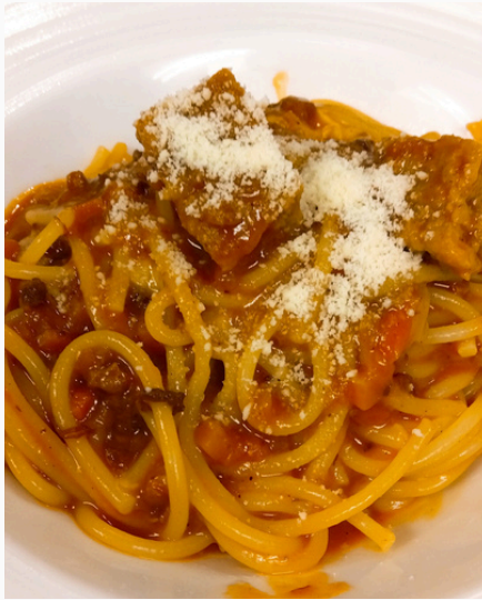
ミートソースパスタ